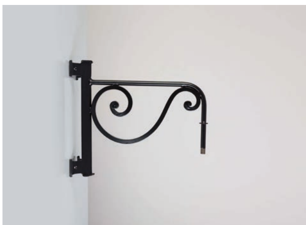
Potence d'angle 40 cm - Finition laque noire Corner bracket down, 40 cm, black painting