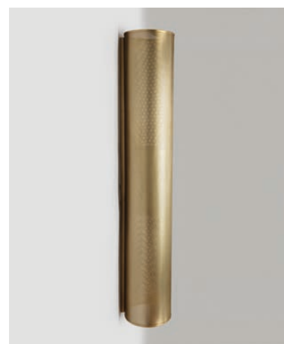
Applique Yoko GM - Finition laiton brossé Yoko wall light, L size, brushed brass