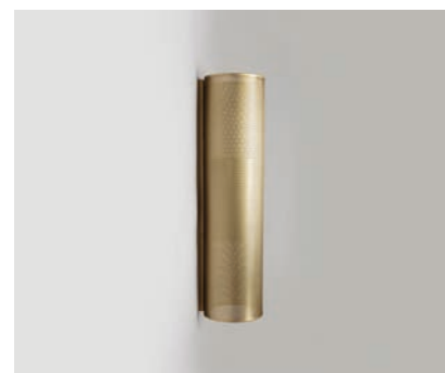
Applique Yoko MM - Finition laiton brossé Yoko wall light, M size, brushed brass