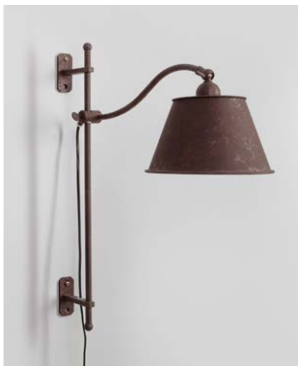
Applique Whist GM - Finition vieux fer rouillé Whist wall light, L size, rust painting

The Whist Collection is inspired by the office lamps from the 1940s and includes a reading lamp, table lamp and wall light. Adjustable in height with a pivoting head, this collection has a touch of nostalgia but features a timeless industrial aesthetic.