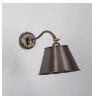
Applique Whist MM - Finition laiton patiné acide Whist wall light, M size, acid patinated brass