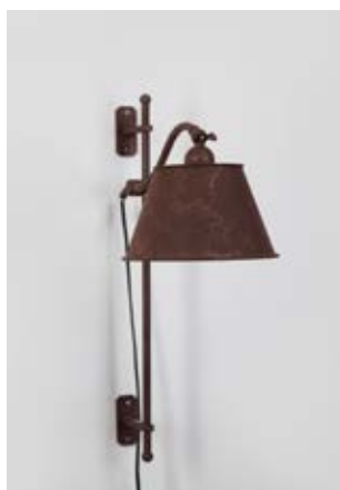
Applique Whist GM - Finition vieux fer rouillé Whist wall light, L size, rust painting