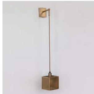
Applique Sabin PM - Finition laiton patiné Sabin wall light, S size, patinated brass