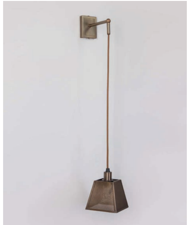
Applique Sabin MM - Finition laiton patiné acide Sabin wall light, M size, acid patinated brass

The pendant light transformed into wall light for the Sabin Collection comes in three sizes of shades, all made out of micro-perforated brass for a graphic light effect on your walls. Perfect for framing a bed headboard or to create a rhythmic pattern in a hallway when installed in a series.