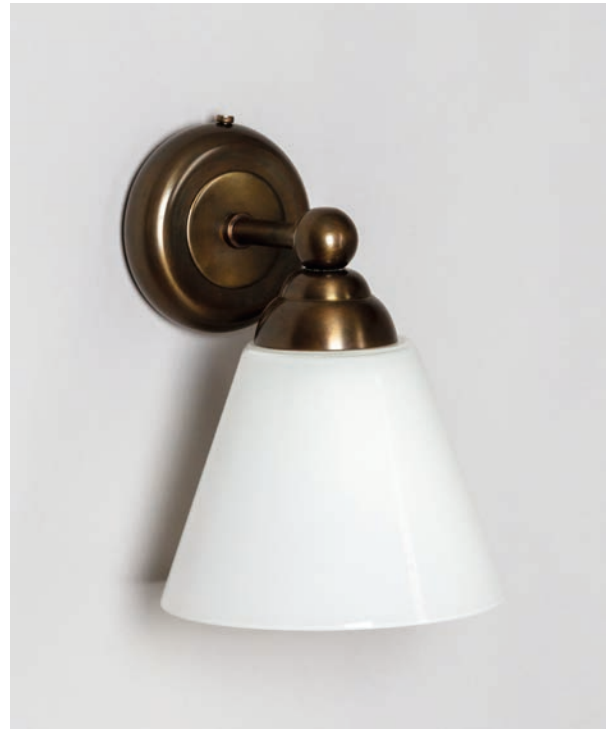
Applique Roquebrune - Finition laiton patiné acide Roquebrune wall light, acid patinated brass

The Roquebrune wall light with its simple, curved design combines brass in every finish imaginable with opaline glass. Ideal in the bathroom, to frame a mirror for example.