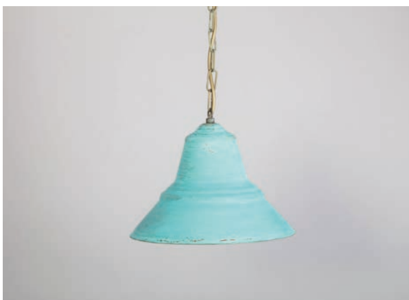
Suspension Madrague 28 cm - Finition vert de gris Madrague pendant, 28 cm, verdigris