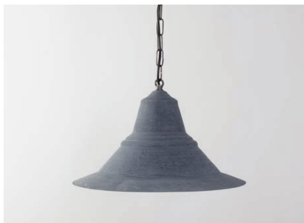
Suspension Madrague 38 cm - Finition vieux zinc Madrague pendant, 38 cm, aged zinc