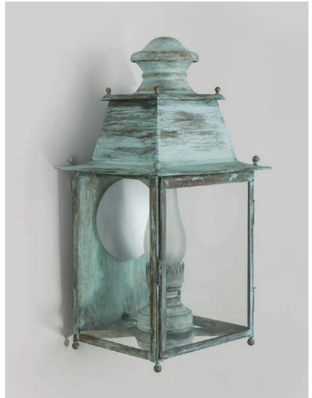
Applique Gare TGM - Finition vert de gris Gare wall lantern, XL size, verdigris

The Gare Collection is a successor of the antique kerosene lamps. With its spout and glass, it mimics it to a tee. Historically, this type of lantern would be found in the communal areas of large 19 th century homes but today why not place it in a country-home or cottage.