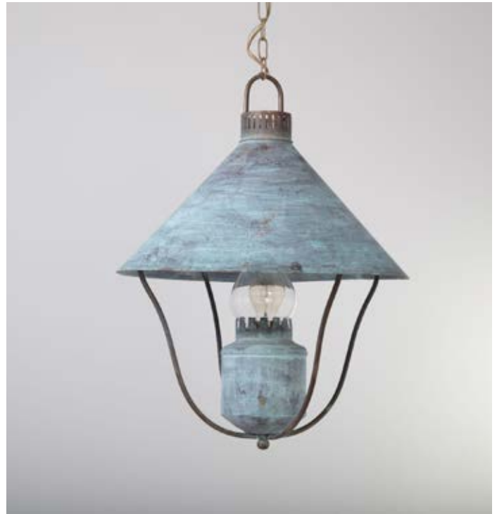
Suspension Grange - Finition vert de gris Grange pendant, verdigris

The Grange lantern is a subtle reinterpretation of the kerosene lamps of yore. The spout and glass create a sense of nostalgia despite the fact that it is an electric lamp. Ideal for a kitchen, hallway or barn.