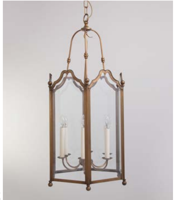
Lanterne Sévigné TTGM - Finition laiton patiné Sévigné lantern, XXL size, patinated brass

This collection of interior lanterns evokes the spirit of the 17 th century. The body of these six-sided lanterns is subtly enhanced with delicately crafted foliage scrolls, topped with brass balls. The three- or six-light chandelier is housed in this transparent cage. Ideal for entrances, lobbies, galleries, and hallways.