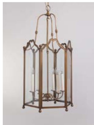
Lanterne Sévigné TTGM - Finition laiton patiné Sévigné lantern, XXL size, patinated brass