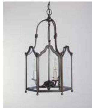
Lanterne Sévigné TGM - Finition canon de fusil Sévigné lantern, XL size, gun metal