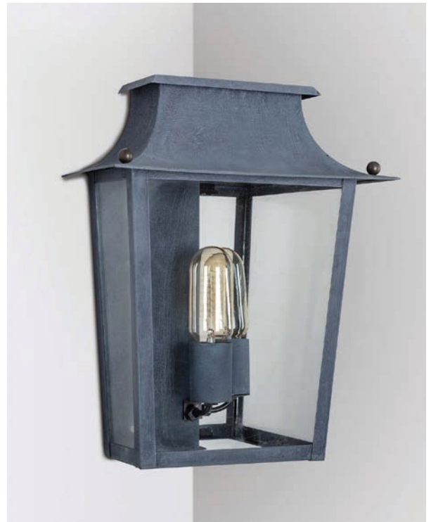
Lanterne Passy GM - Finition vieux zinc Passy lantern, L, aged zinc

The simple lines decorated with delicate brass balls make the Passy Collection a true 19 th century-inspired classic that goes beautifully with many different types of architectures. The Passy lanterns also pair nicely with the Alma wall lights.