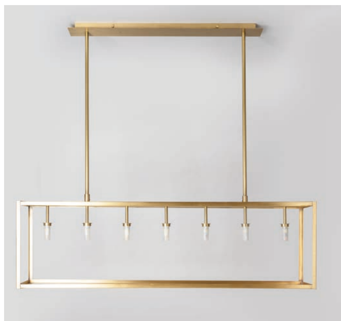
Lustre La Varenne TTGM - Finition Finition laiton brossé La Varenne chandelier, XXL size, brushed brass

This modern and sleek collection of chandeliers and wall lights has no glass frame, only a brass structure holds the two, five or seven lights of the chandelier, which are themselves encased in a sandblasted cylinder. With a large flexibility in terms of height adjustment, you can position the chandelier at the precise distance you want from your table or workspace. Integrate it into a classic décor for a daring contrast!