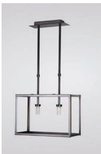
Lustre La Varenne MM - Finition canon de fusil La Varenne chandelier, M size, gun metal