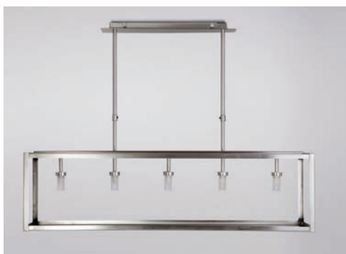
Lustre La Varenne TGM - Finition nickel brossé La Varenne chandelier, XL size, brushed nickel