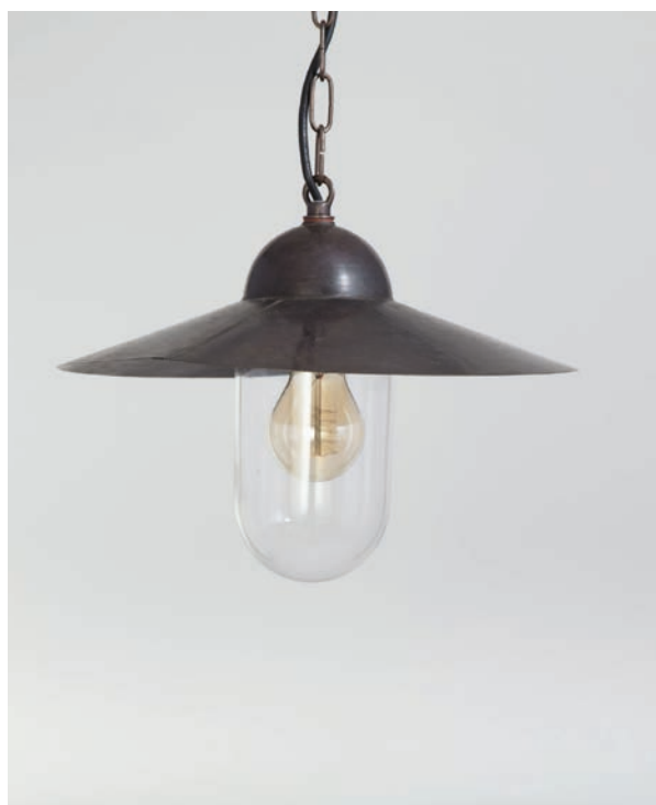
Suspension Cour Cheverny GM - Finition vieux laiton Cour Cheverny pendant, L size, antique brass

A faithful take on the 19 th century swan neck lamps, the Cour Cheverny Collection includes a floor lamp, pendant light, and wall light. Choose the oblique wall light over a door or opening and the horizontal wall lights along a wall in a repetitive pattern. The wall light and pendant light can also be installed indoors to give an industrial look to a kitchen for example.